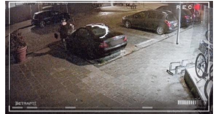
▲ Thijs Zeeman confronteert een reeds veroordeelde vrouw met haar daden in het Talpa-programma Betrapt! . De presentator loopt mee, vanaf haar werk tot helemaal in de metro, en roept haar naam. Vincent TV Producties vervaagde haar gezicht licht. Het vlak over deze schermfoto is van NRC.